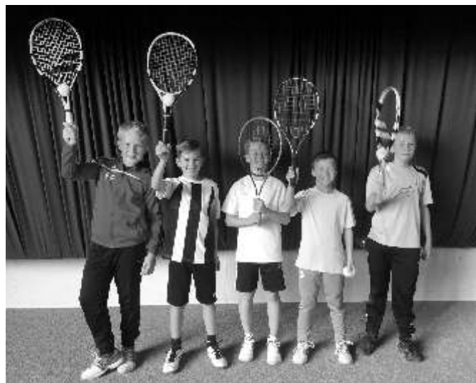
Übung macht den (Kreis-)Meister (siehe nächste Seite)