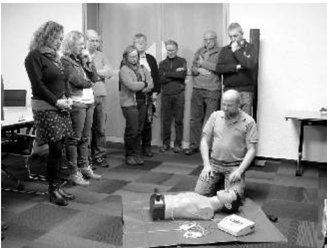
Demonstration des Defibrillators

„Jahreshauptversammlung“ DEFI jetzt auch im Tennisheim