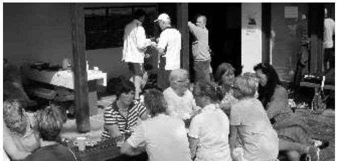
Besucher und Aktive

Zahlreiche Besucher und Zuschauer genossen den herrlichen Frühlingstag bei Kaffee und Kuchen und ließen sich, so wie die Spieler, den Tag nicht durch ein paar Regentropfen verderben.