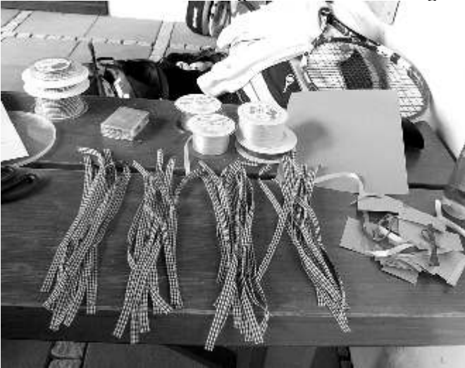
Die Schleifchen liegen bereit

wurde tonnenweise vermooster und verschmutzter Sand von den Plätzen abgetragen und frischer Sand aufgebracht und unter der Leitung unseres Platzwarts Klaus Präger fachgerecht verfestigt.