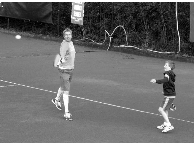
Doppel ohne Altersklassen auf frischem Sand

wurde tonnenweise vermooster und verschmutzter Sand von den Plätzen abgetragen und frischer Sand aufgebracht und unter der Leitung unseres Platzwarts Klaus Präger fachgerecht verfestigt.