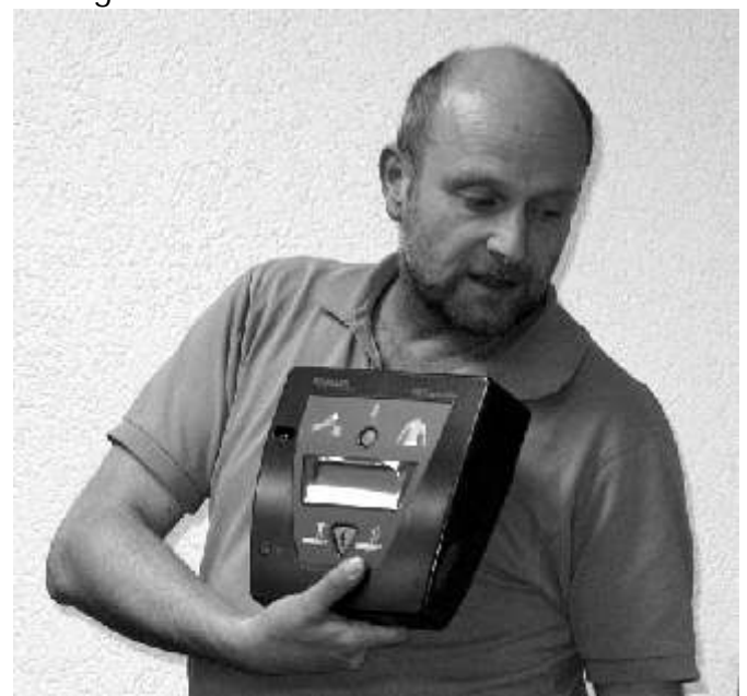
Die Bedienung ist einfach und selbst erklärend

Der erste Vorstand bedankt sich bei den Spendern, die die Beschaffung des Defibrillators ermöglicht haben.